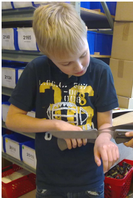
Er det mon en sparekniv?