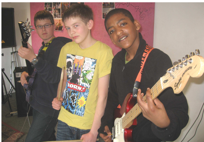
Børnekulturen blomstrer, musikken fylder meget i børnenes liv. Det er skønt!

Især mange fra 6 årgang har benyttet sig af tilbudet om, at komme i klub om aftenen og vi har et håb om, at det giver en god overgang til næste år, hvor de har mulighed for, at komme i ungdomsklubben.