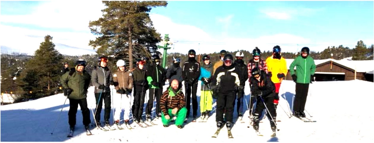
Fra klubbens skitur 2018

I Norge skal vi selv sørge for madlavning, oprydning, rengøring m.v. Det forventer vi, at alle deltager i!